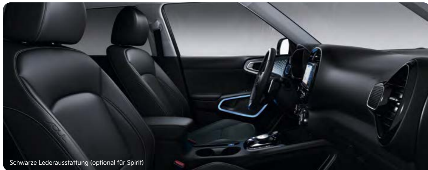
Schwarze Lederausstattung (optional für Spirit)

Ohne Abbildung: schwarze Stoffsitze (Edition 7)