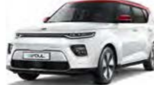
Schneeweiß mit rotem Dach (AH1)