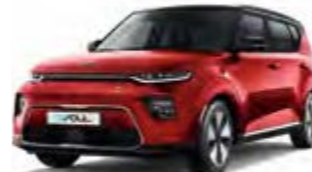
Infernotrot Metallic mit schwarzem Dach (AH4)