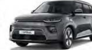
Gravitygrau Metallic (KDG)