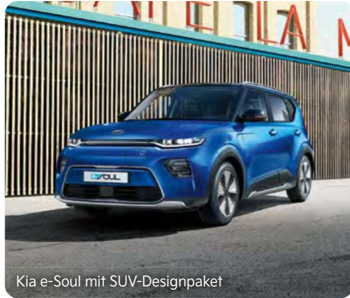
Kia e-Soul mit SUV-Designpaket