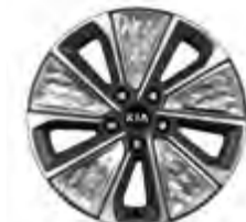
17-Zoll-Leichtmetallfelgen mit Bereifung 215/55 R17

Bei einigen unserer modernen Metallicfarben werden bewusst unterschiedliche Farbpigmente verwendet. Dadurch können unter bestimmten Lichtverhältnissen, z.B. direktes Sonnenlicht, attraktive Farbeffekte erzielt werden. Zum Teil kann die Farbe changieren, z.B. von Schwarz zu Dunkelblau. Bei den hier abgebildeten Farbdarstellungen kann es aufgrund der Drucktechnik zu Abweichungen zu den Originalfarben kommen. Weitere Informationen zu den Farbeffekten und Grundfarben gibt Ihnen gerne Ihr Kia-Vertragshändler. Metalliclackierungen sind aufpreispflichtig.