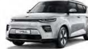
Sparklingsilber Metallic (KCS)