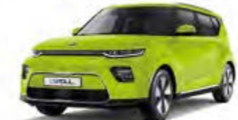
Space Cadet Green (CEJ)