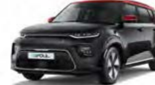
Cassisschwarz Metallic mit rotem Dach (AH5)