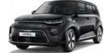
Cassisschwarz Metallic (9H)