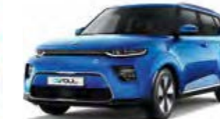
Neptunblau Metallic (B3A)