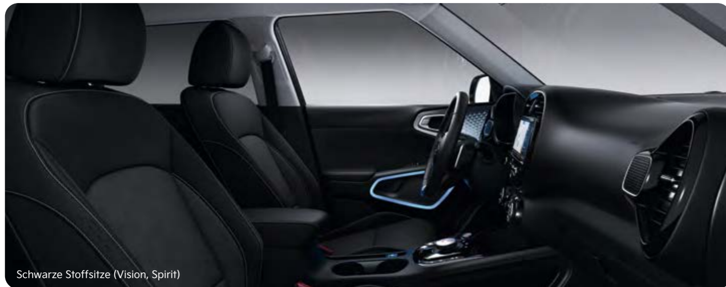
Schwarze Stoffsitze (Vision, Spirit)

Das Qualitäts-Interieur des Kia e-Soul präsentiert sich mit sorgfältig ausgewählten Materialien. Für die Sitze stehen schwarze Bezüge in Stoff und Leder zur Wahl.