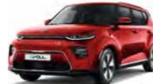
Infernotrot Metallic (AJR)