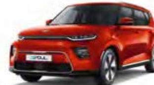
Marsorange Metallic (M3R)