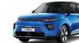
Neptunblau Metallic mit schwarzem Dach (SE2)